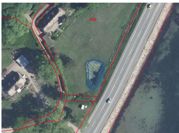
Ejendommen med §3-beskyttet sø