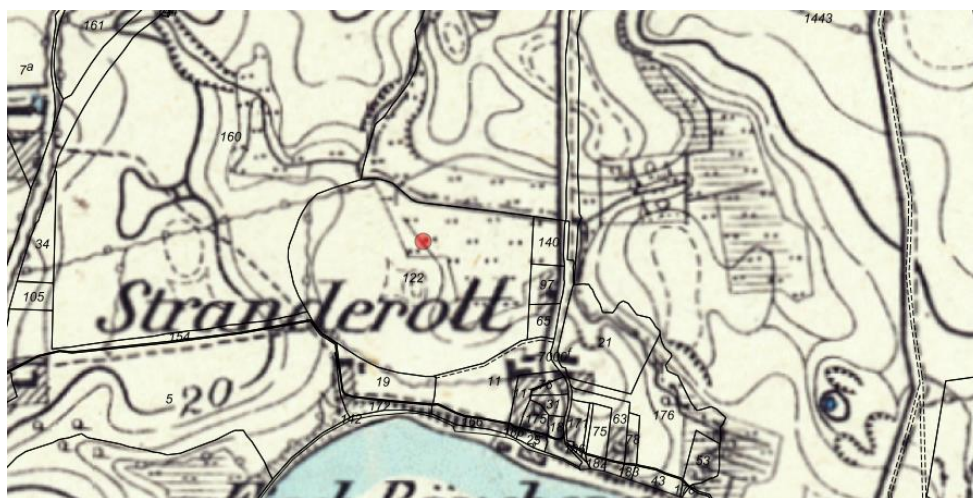
Fig. 3. Historisk baggrundskort, præussiske målebordsblade 1877-. Den røde prik markerer matriklen, hvor søerne ønskes etableret.

Kystdirektoratet har ud fra en gennemgang af ortofotos samt historiske baggrundskort vurderet, at der ikke tidligere har været en naturlig sø på den ansøgte placering (se fig. 3).