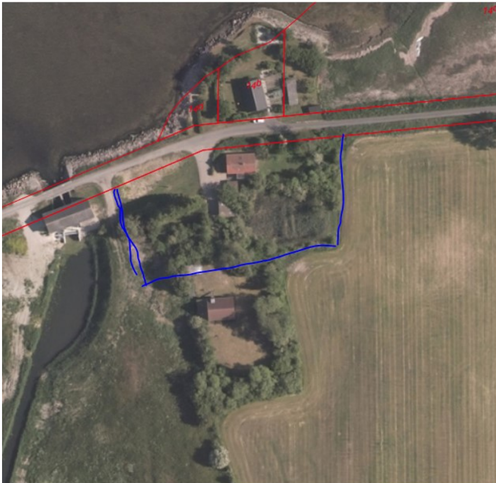
Kystdirektoratets indtegning af nyt skel (omtrentlig beliggenhed) Under: nye skel jf. ansøgningen