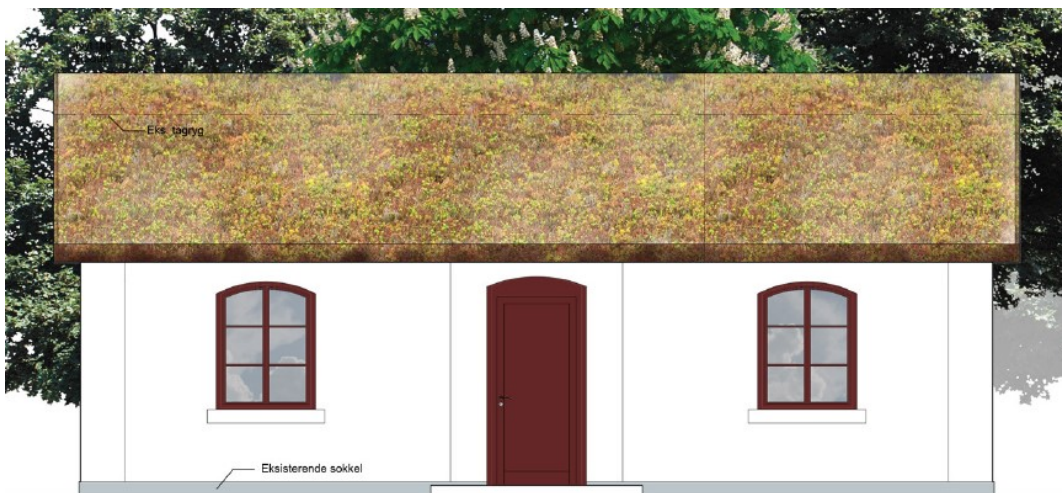
Ansøgt udhus og eksisterende (under)