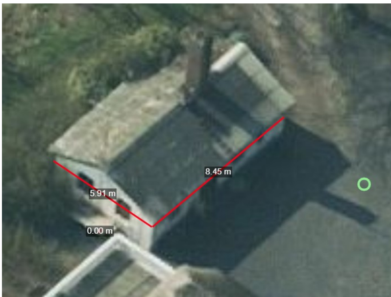
Opmåling jf. luftfoto – øverst murdimensioner Under: tagfladen

Opmålt ud fra luftfotografier er udhusets dimensioner ca. 5,9 x 8,6 m, svarende til et areal på ca. 51 m 2 . Tagfladens areal (bebygget areal samt udhæng) er ca. 53 - 54 m 2 , og med et tagudhæng på ca. 20 cm vil det bebyggede areal være ca. 47-49 m 2 .