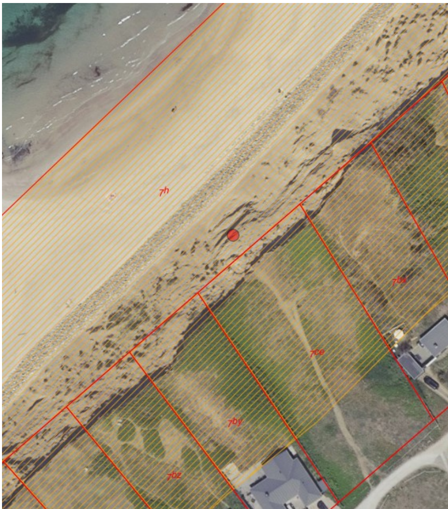
Fig. 1. Ortofoto 2020. Det orange skraverede område markerer det strandbeskyttede areal. De røde streger markerer de vejledende matrikelskel. Trappens placering er omtrentligt angivet med en rød prik. Trappen placeres fra skræntoverkanten til kystbeskyttelses anlægget på stranden.