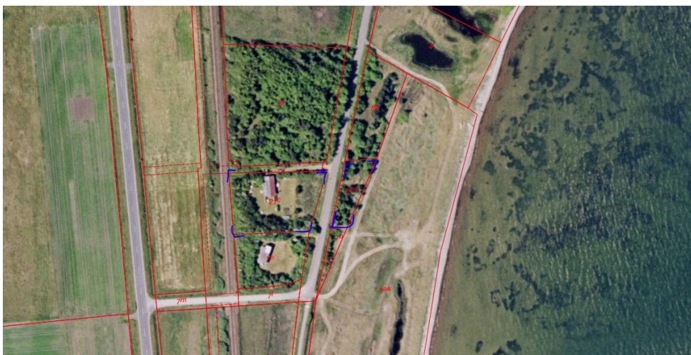
Ejendommen markeret med blå