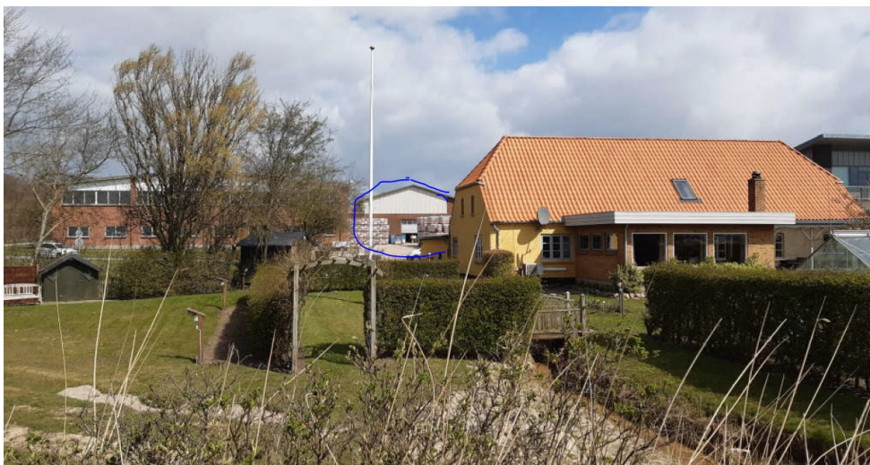
Set fra kysten – tilbygningen placeres i forlængelse af blå markeret bygning