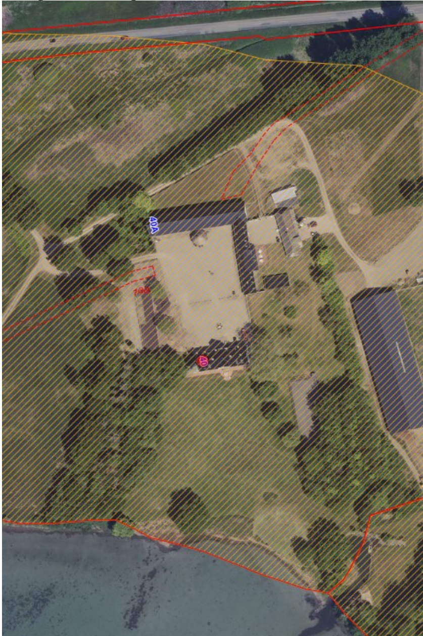
Fig. 1. Ortofoto 2020. Det orange skraverede område markerer det strandbeskyttede areal. De røde streger markerer de vejledende matrikelskel. Bygningen er markeret med en rød prik.

Hovedbygningen på Bjørnemose Gods, Bjørnemosevej 40, 5700 Svendborg er delvist nedbrændt, og der søges om genopførelse af bygningen.