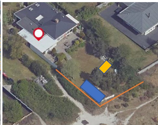
Placeringen af skurvognene