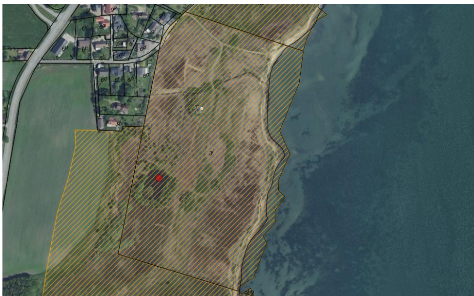
Fig. 1. Ortofoto 2020. Den røde prik markerer den eksisterende sø. Det orange skraverede område markerer det strandbeskyttede areal. De sorte streger markerer de vejledende matrikelskel.

Morsø Jagthundeclub har ansøgt om dispensation fra strandbeskyttelseslinjen til udvidelse af en eksisterende sø på ca. 1418 m 2 med yderligere 482 m 2 på ovennævnte matrikel. Matriklen er i sin helhed omfattet af strandbeskyttelseslinjen (se fig. 1).