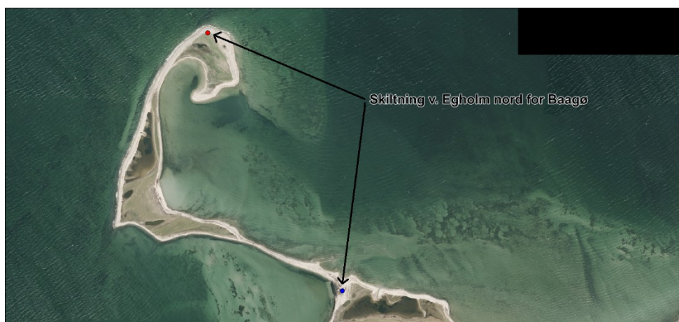
Figur 1, kortbilag fra ansøgning, der viser placeringen på Egholm. Blå prik er eksisterende skilt.

Assens Kommune har indhentet lodsejeraccept til opsætning af skiltene.