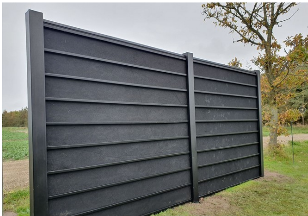
Fig. 4. Billedeksempel på ønsket støjhegn.