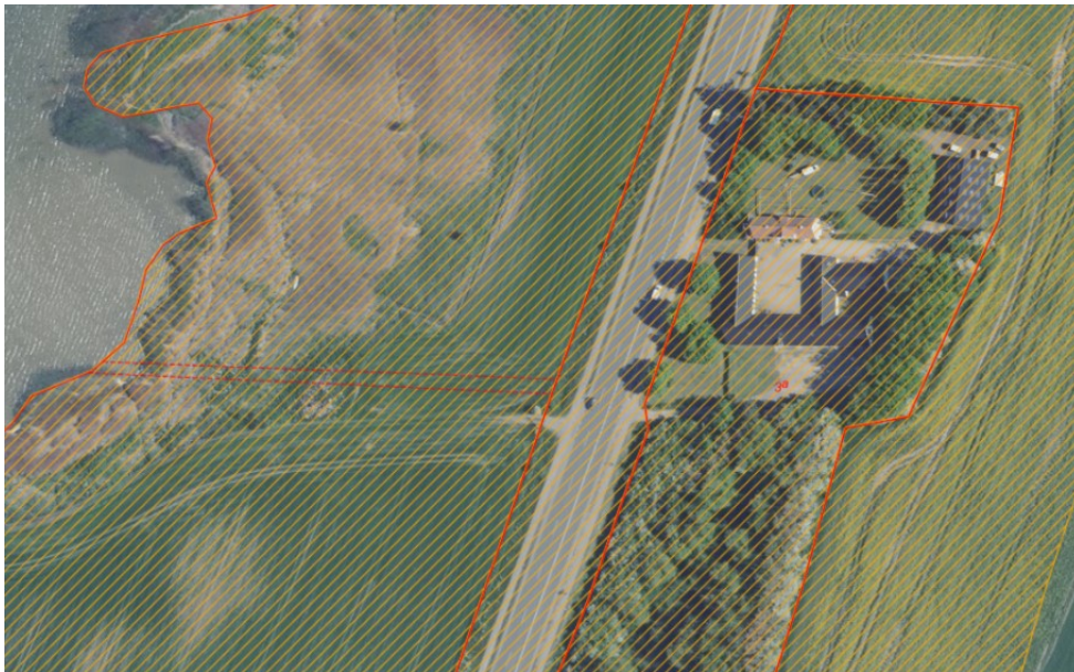
Fig. 1. Ortofoto 2020. Det orange skraverede område markerer det strandbeskyttede areal. De røde streger markerer de vejledende matrikelskel.

Kystdirektoratet varslede afslag på ansøgningen d. 26. oktober 2020, men ansøger er ikke kommet med yderligere oplysninger.