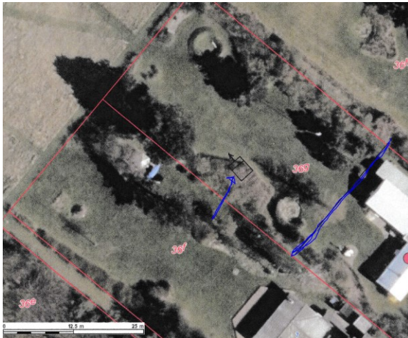
Blå linje strandbeskyttelseslinjen – pil: skuret