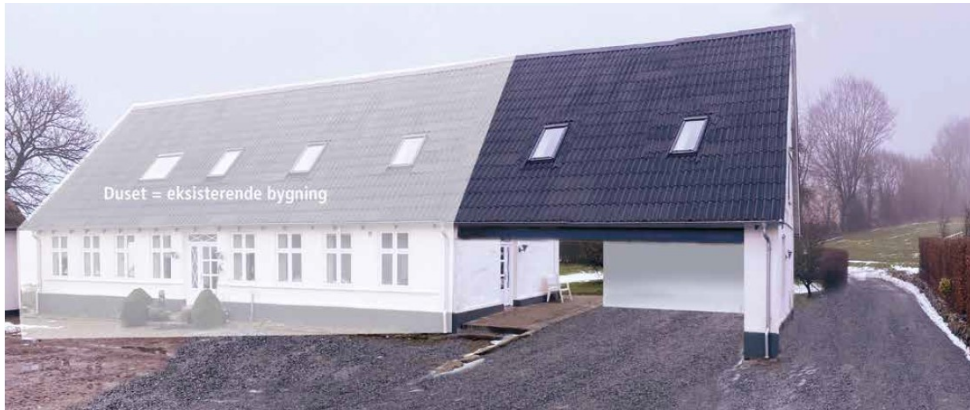
Tilbygningen – boligudvidelsen på 1. sal.

overetagen udvides boligarealet med ca. 54 m 2 gulvareal (opgjort ud fra fremsendt grundplan og ikke efter BBR-regler), hvorved det samlede boligareal bliver op mod 290 m 2 .