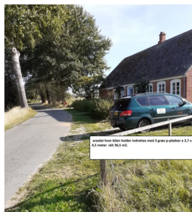
Areal for parkering