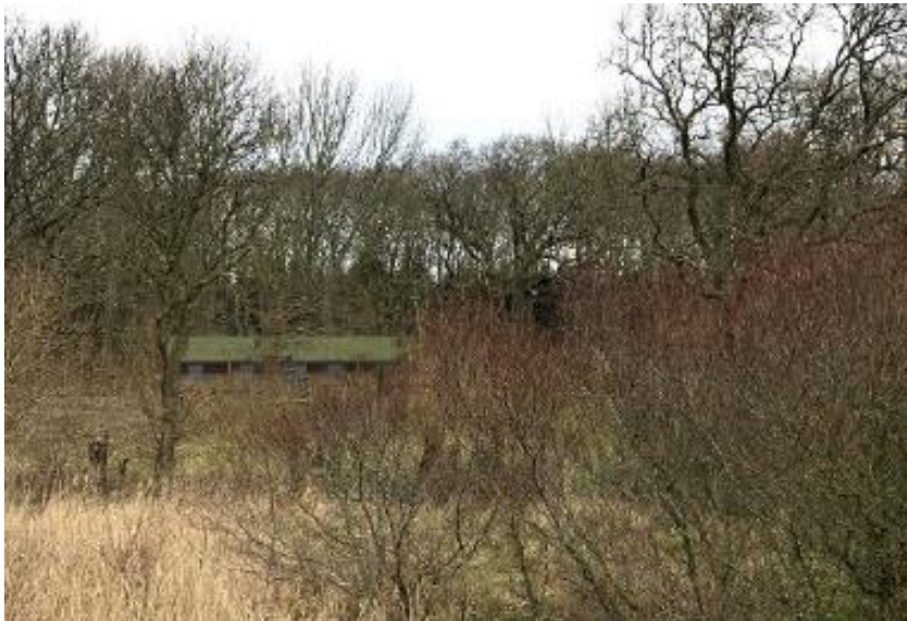
Fig. 7. Visualisering af den ansøgte natur- og friluftshytte.

Det fremgår af ansøgningen, at byggepladsen vil være ca. 400 m 2 , mens den nærliggende flis- og parkeringsplads vil kunne fungere som materialeplads på ca. 380 m 2 . Der vil ifølge ansøgningen derfor være en minimal påvirkning af eksisterende træer.