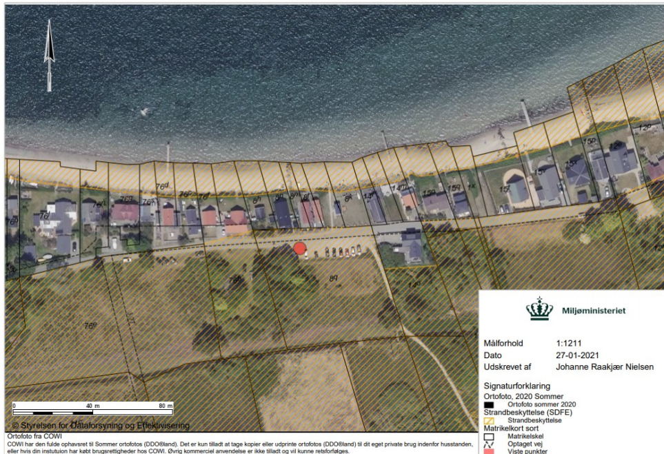
Fig. 2. Ortofoto 2020. Det orange skraverede område markerer det strandbeskyttede areal. Den røde prik markerer området, hvor affaldsstation ca. ønskes etableret. De sorte streger markerer de vejledende matrikelskel.