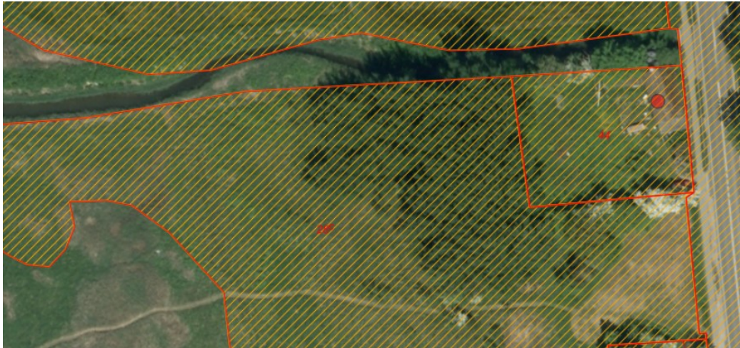
Ortofoto 2014, hvor den daværende bolig ses ved prikken. Det orange skraverede område markerer det strandbeskyttede areal. De røde streger markerer de vejledende matrikelskel.

Ansøgningen om forlængelse af dispensationen er helt uændret.