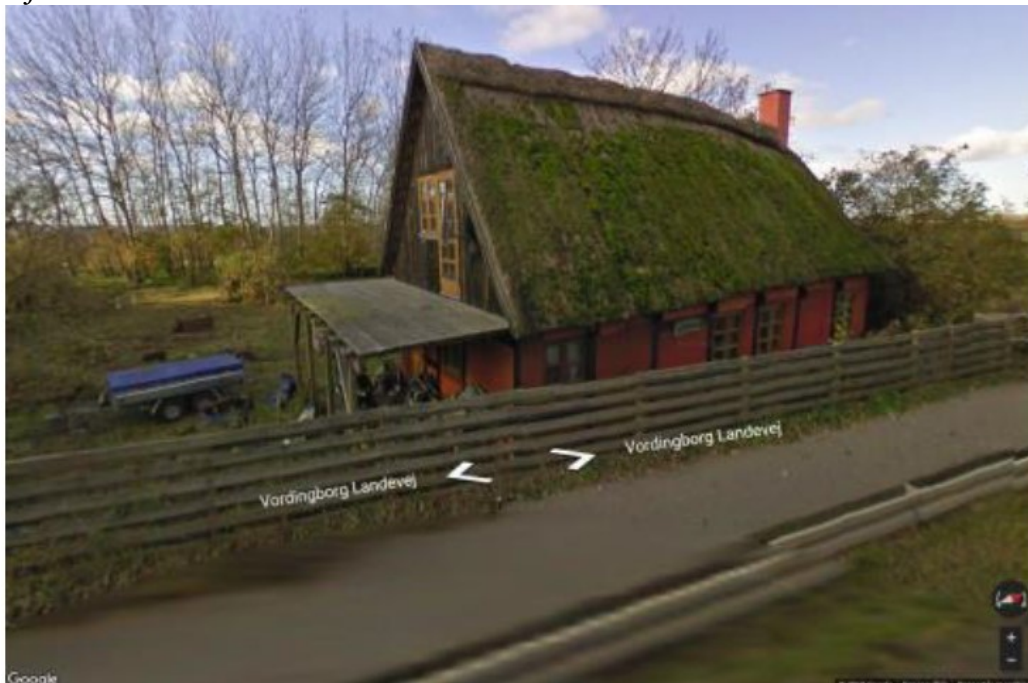
Her ses den oprindelige bolig, billedet er fra Street View

Ansøger anfører bl.a. følgende om den manglende udnyttelse af den oprindelige dispensation inden for tidsfristen på 3 år: