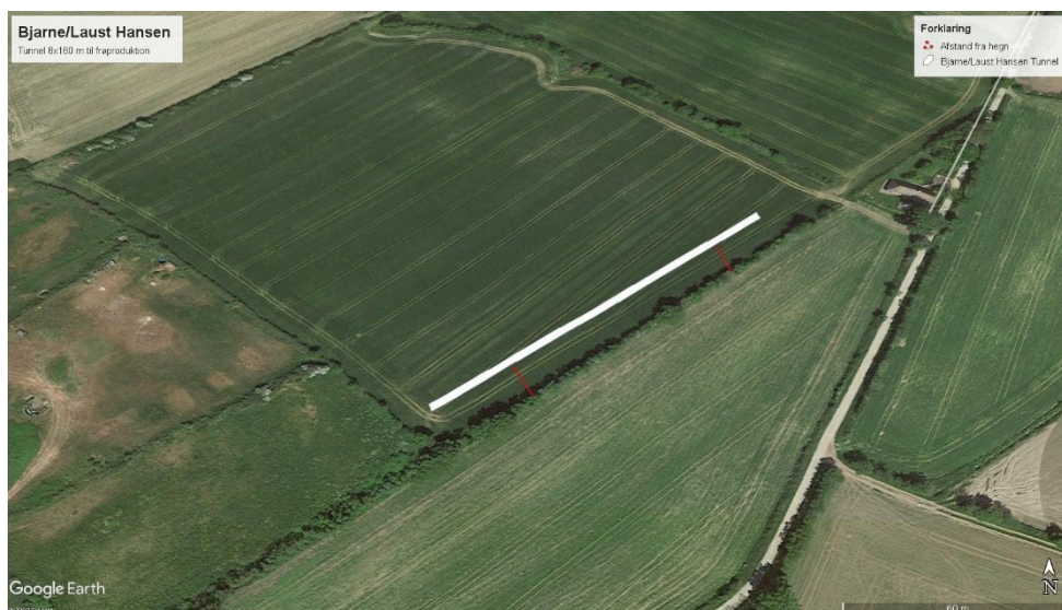
Figur 2, kortbilag fra ansøgningen med visualisering af tunnelen

Af ansøgningen fremgår følgende, som er kopieret fra ansøgningen: