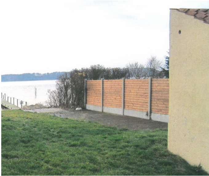
Foto, der viser den etablerede terrasse. Hjørnet af udhuset/bådehuset ses til højre. Indsat fra ansøgningen.