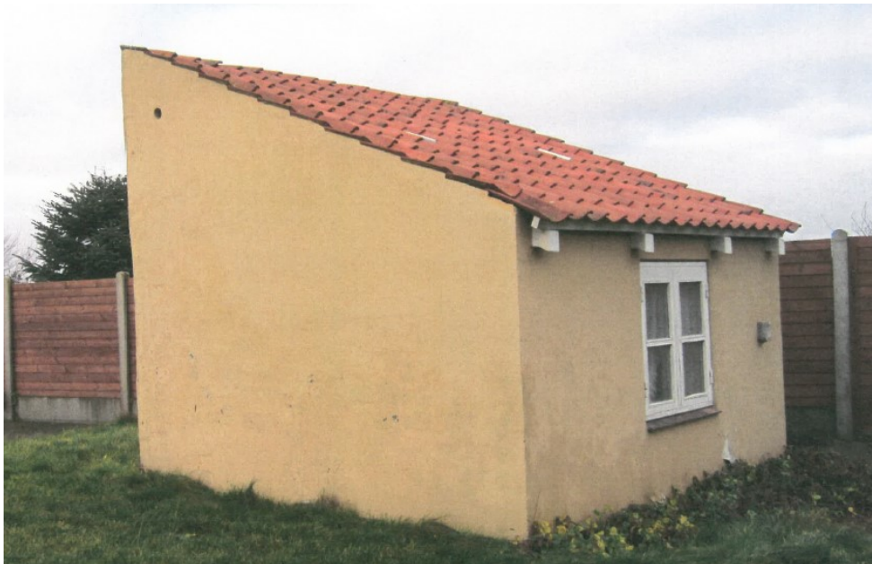
Foto af eksisterende bådehus. Indsat fra ansøgningen.