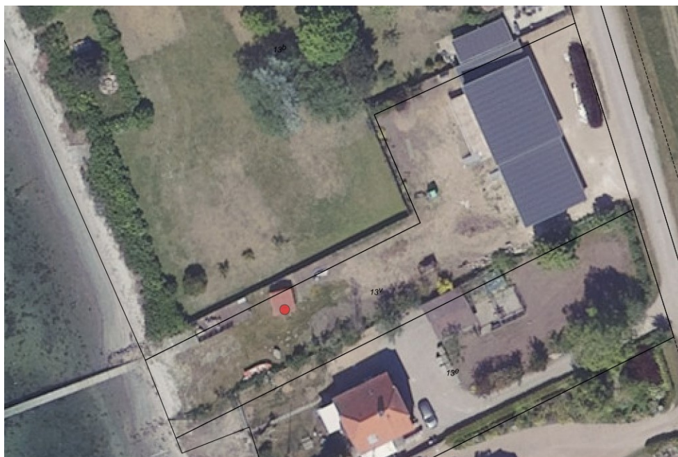
Fig. 1. Ortofoto 2020, der viser ejendommen. Det udhus, der søges ombygget og udvidet er markeret med en rød prik

Det eksisterende udhus/bådehus er 11 kvm og opført med ensidig taghældning, der er 3,2 meter på det højeste sted. Det ansøgte udhus/bådehus er også 11 kvm i grundplan og 3,2 meter på det højeste sted. Det nye udhus/bådehus har en revleport mod vandet for isætning af en båd.