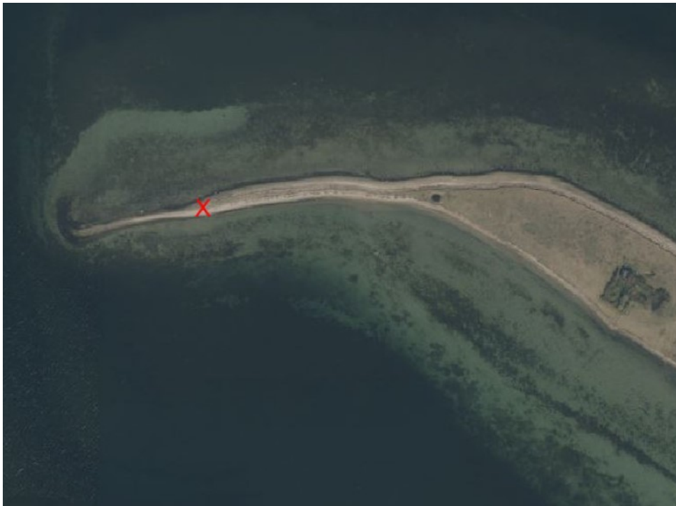
Figur 2, vestlige del af Lilleø, med kryds der viser placering af skiltet