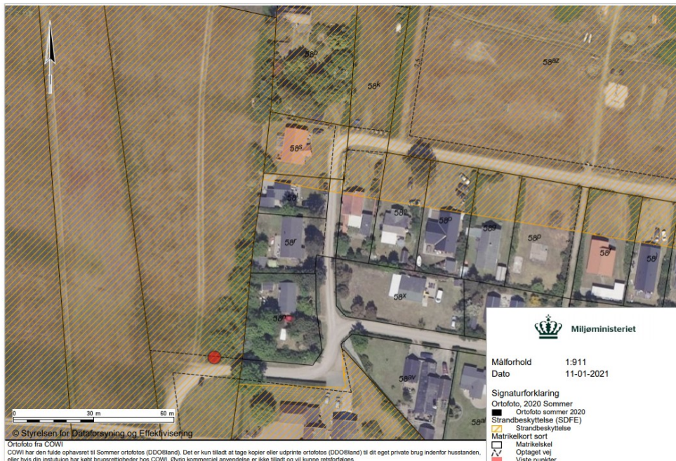
Fig. 2. Ortotofo 2020. Det orange skraverede område markerer det strandbeskyttede areal. De sorte streger markerer de vejledende matrikelskel. Den røde prik markerer området, hvor affaldsstationen ønskes etableret.