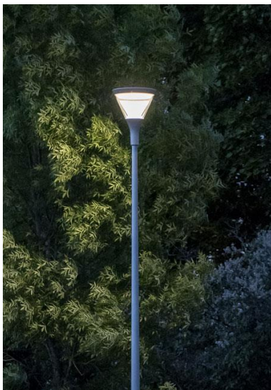
Figur 5. Indsendt af ansøger. Viser den type af belysning, der etableres.