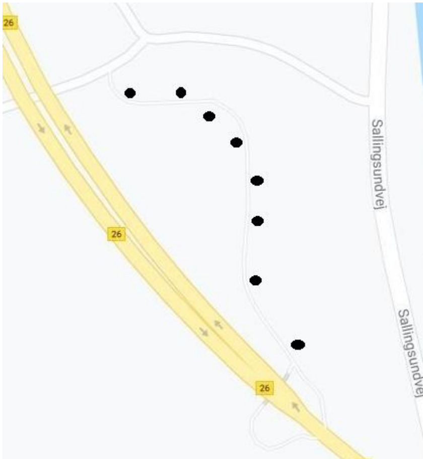
Figur 4. De sorte prikker viser placeringen af parklamperne ved stien.

Der ansøges derfor om at etablere otte parklamper på strækningen, se figur 4 og 5.