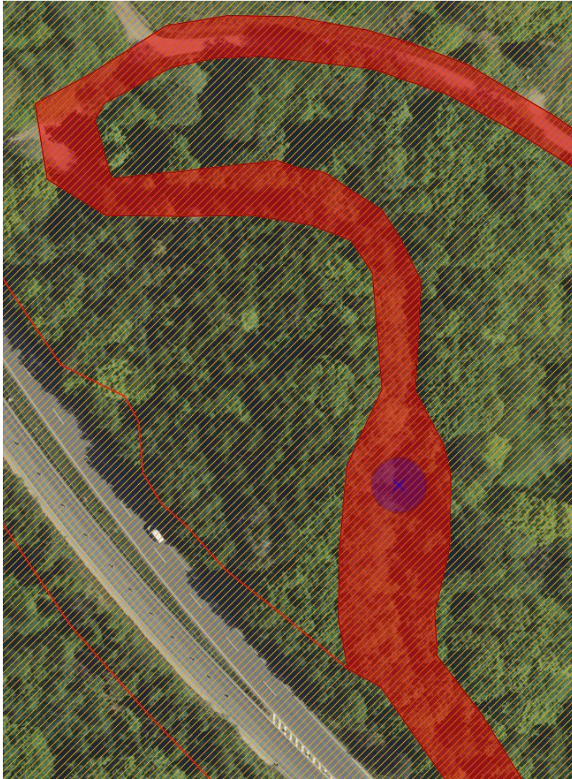
Fig. 1. Ortofoto 2020. Det orange skraverede område markerer det strandbeskyttede areal. De røde streger markerer de vejledende matrikelskel. Den røde markering viser den ansøgte matrikel.

Det ansøgte etableres på matr. 7000a, der ligger inden for strandbeskyttelseslinjen. Se figur 1.