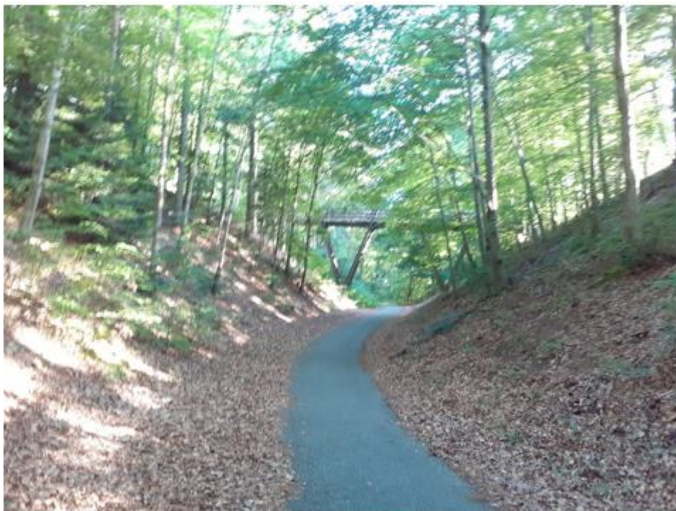
Fig. 2. Viser stien ligger i en slugt omgivet af skov.

Kommunen har modtaget henvendelse fra borgere, som giver udtryk for, at strækningen fremstår utryk og usikker på grund af manglende belysning. Der er særligt skarpe sving, der er usikker i mørke, hvor belysning kan øge trafikikkerheden. Se figur 3.