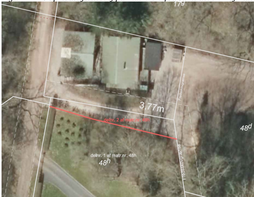
Figur 1 – Den private fællesvej på matr. nr. 48d samt delnr. 2 af matr. nr. 48h

På figur 2 er vist den ønskede matrikulære ændring.