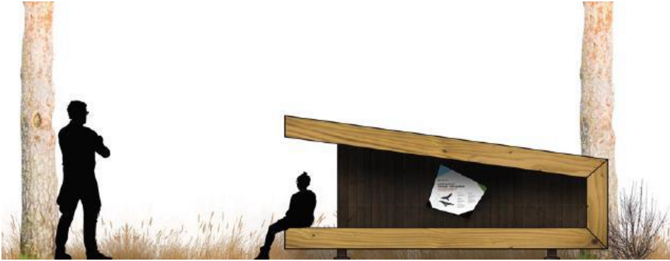
Referencebillede. Shelter efter Naturstyrelsens sheltermodel 1.7.

Det fremgår af ansøgningen, at shelteret har plads til fire personer. På shelteret monteres der et mindre skilt med informationer om regler for brug og områdets muligheder.