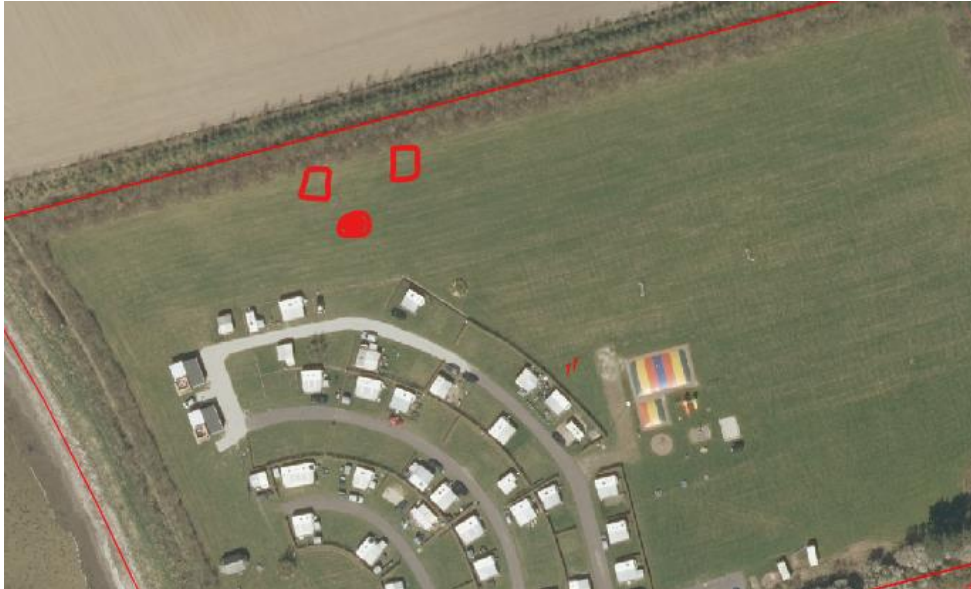
Fig. 2. Kort fra ansøgningen. De to røde firkanter markerer placeringen af de to sheltere. Den røde cirkel markerer bålpladsen. De røde streger markerer matrikelskel.

Ifølge ansøgningen vil den ansøgte shelterplads være åben for offentligheden og målrettet mange forskellige typer af brugere såsom kajakroere, cykellister og vandrere. Kajakroere har adgang til shelterpladsen via en sandstrand. Andre besøgende som vandrere, cyklister og bilister har adgang via Nakskov Fjord Camping