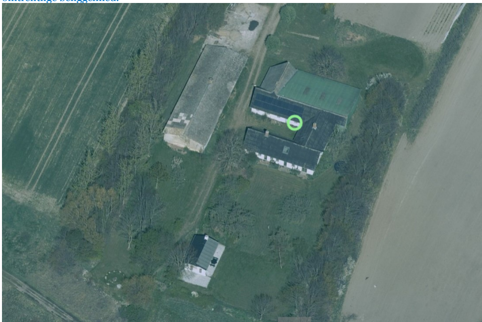
Figur 2, skråfoto april 2019 af det eksisterende byggeri