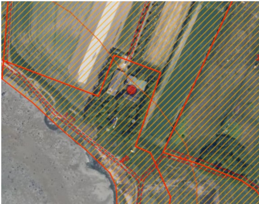
Figur 1, ortofoto 2020. Det orange skraverede område markerer det strandbeskyttede areal. De røde streger markerer de matrikelskel og den orange linje den oprindelige 100 m strandbeskyttelseslinjes omtrentlige beliggenhed.