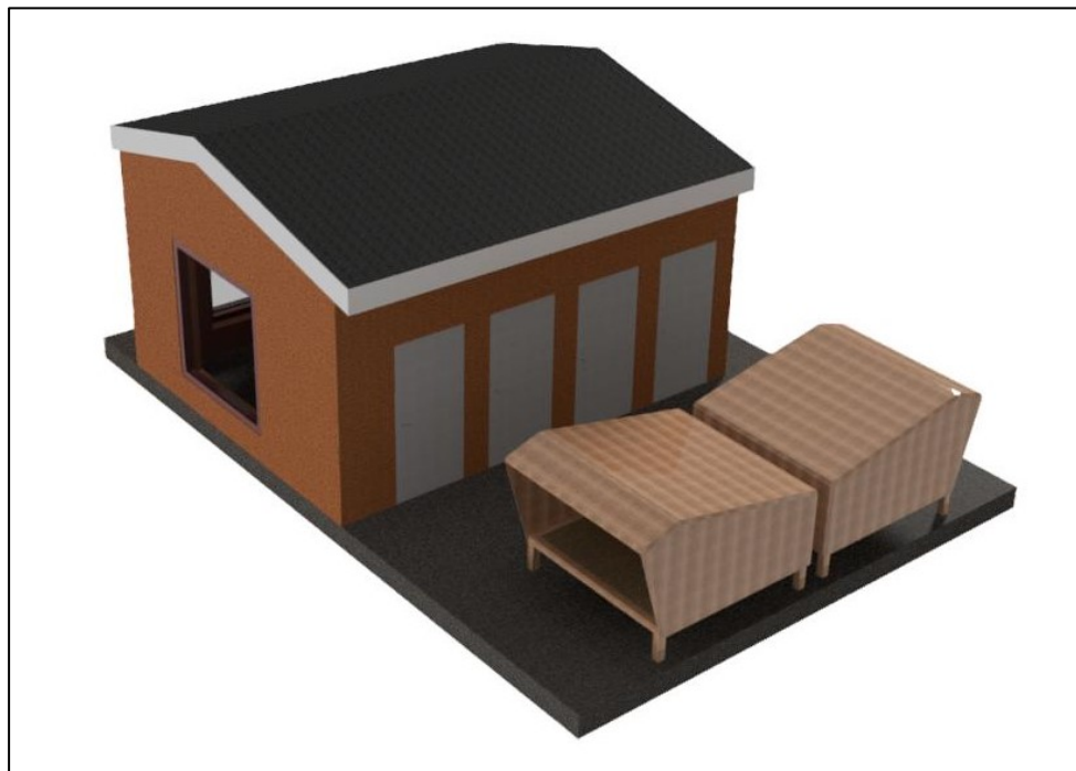
Fig. 3. Illustration af de ansøgte anlæg set fra bagsiden. De fire døre er indgang til toiletter, omklædning og teknikrum.