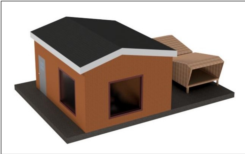
Fig. 2. Illustration af de ansøgte anlæg. Bygningen i forgrunden indeholder klubhus, toiletter, omklædning og teknikrum. Bagved ses de to shelters. Rundt om er et terrasseareal.