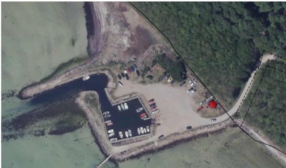
Fig. 1. Ortofoto 2020. Det eksisterende klubhus er markeret med en rød prik.

Mod nordøst tæt ved adgangsvejen til området ligger et klubhus for bådelaaget på ca. 12 kvm. Det fremgår af ortofoto, at der har ligget en bygning på denne placering siden i hvert fald 1954. Bygningen anses som lovlig.