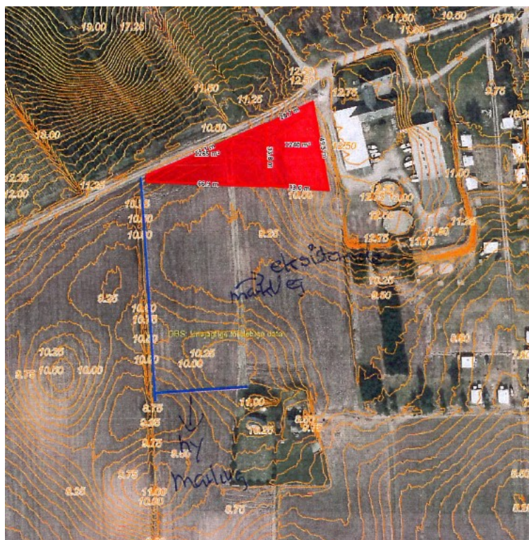
Figur 2, kort fra ansøgningen. Rødt felt viser de nye grunde, blå streg den ønskede vejforlægning

forhold på de to sommerhusgrunde, vejen skal betjene, samt at Assens Kommune har oplyst, at vejen ikke giver udfordringer i forhold til de beskyttede diger.