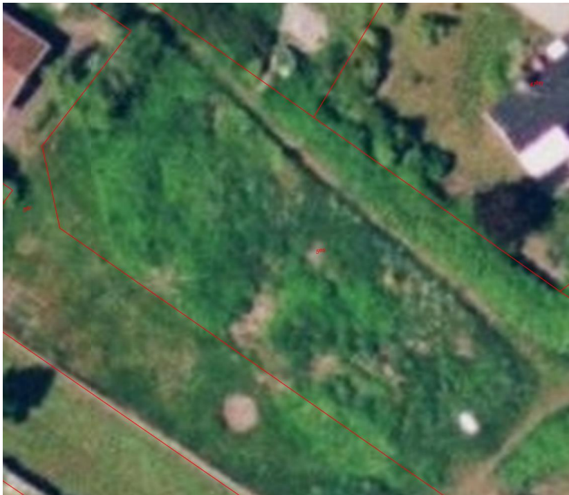
Fig. 6. Luftfoto 2006, viser nabomatriklen, 5es, har været fyldt med beplantning.

Ansøger meddeler pr. mail d. 19-11-20, at der tidligere har været en hybenhæk som hegn på strækning mellem de to matrikler, hvilket ønskes genetableret på samme placering. Ifølge ansøger blev hybenhækken fjernet for ca. 5 år siden. Ud fra fig. 7 kan det ses, at der ikke har været etableret grønt hegn siden 2014.