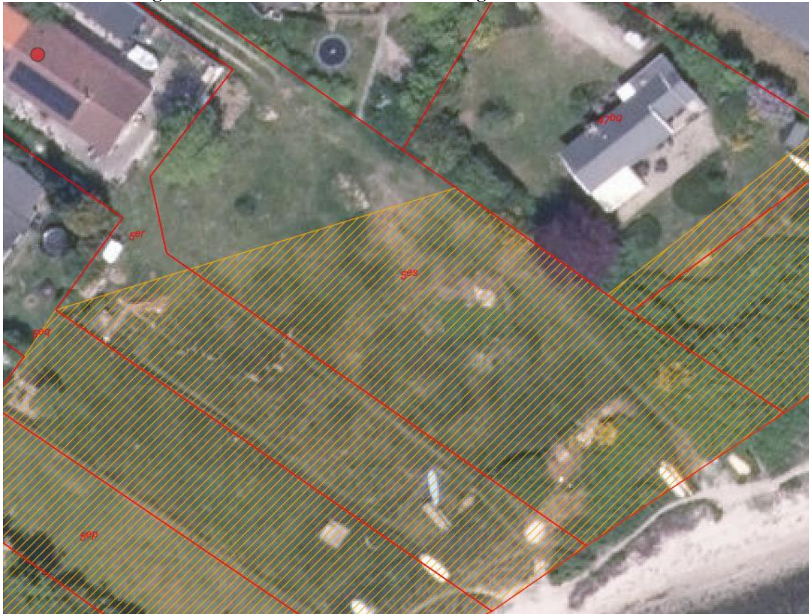
Fig. 1. Ortofoto 2020. Det orange skraverede område markerer det strandbeskyttede areal. De røde streger markerer de vejledende matrikelskel. Den ansøgte matr. 5er, er den som ligger i tilknytning til bygningen markeret med rød prik i toppen af venstre hjørne.

Placeringen af både grønt hegn og bænk er på samme matrikel, som er delvist dækket af strandbeskyttelseslinjen. Ejendommen er et sommerhus, med tilladelse til helårsbeboelse gældende for nuværende beboere. Se figur 1.