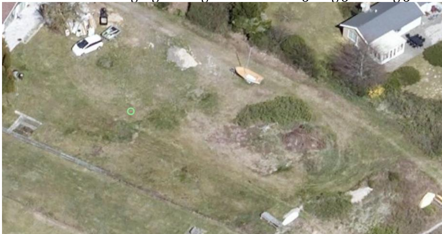
Fig. 5. Skråfoto 2019. Fotoet viser, der ikke eksisterer hegn.

Der eksisterer ikke noget grønt hegn mellem matr. 5er og 5es. Se fig 5.