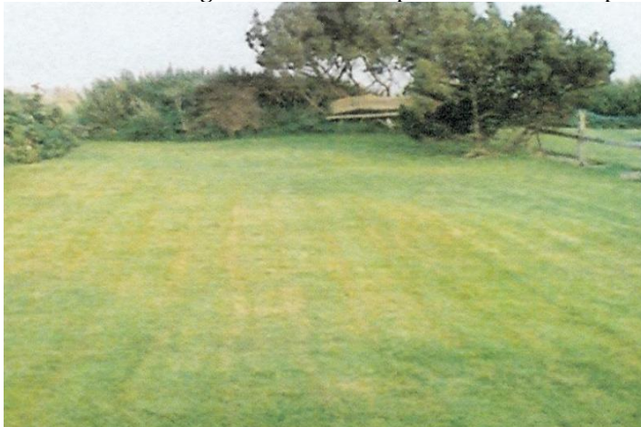
Fig. 3. Foto indsendt af ansøger, dateret fra 1979. Fotoet viser en mindre træbæk forenden af grunden.

Matriklen har tidligere haft en bæk på omtrent samme placering. Se figur 3.