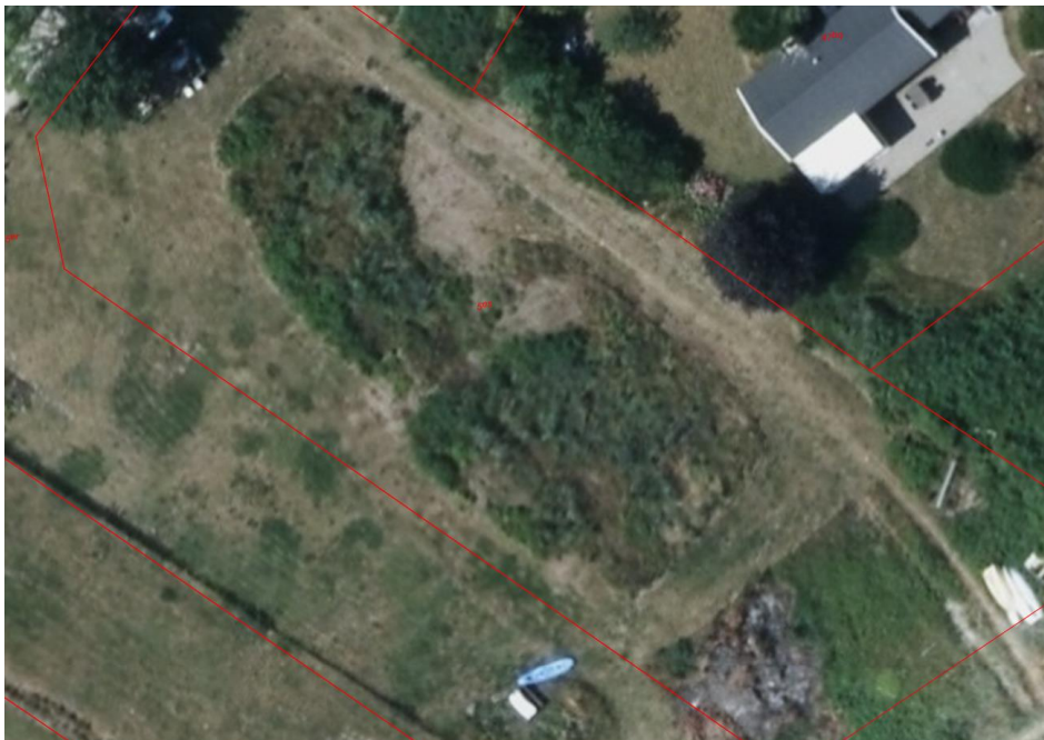
Fig. 7. Orlogsfoto 2014. Fotoet viser spredt beplantning på nabogrunden, men ingen karakter af grønt hegn mellem de to matrikler.

Ansøger meddeler pr. mail d. 19-11-20, at der tidligere har været en hybenhæk som hegn på strækning mellem de to matrikler, hvilket ønskes genetableret på samme placering. Ifølge ansøger blev hybenhækken fjernet for ca. 5 år siden. Ud fra fig. 7 kan det ses, at der ikke har været etableret grønt hegn siden 2014.