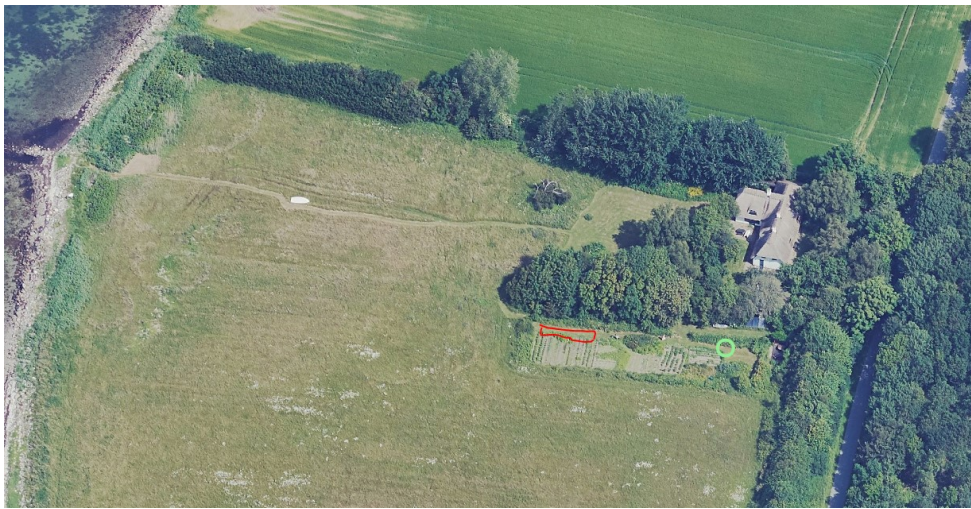
Placering af anlæg

Vores samlede udhusareal kommer ikke til at overstige 50 m 2 , selvom solcelleanlægget medregnes. Svendborg kommune har givet en foreløbig tilkendegivelse af, at de vil tillade anlægget.