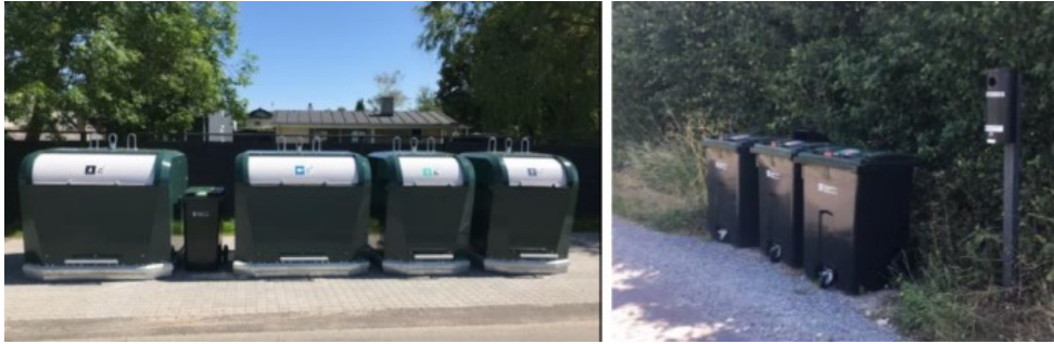
Fig. 1. Eksempel på kubestation (venstre) og beholderstation (højre) fra ansøgningsmaterialet. Beholderstationen vil bestå af i alt 5 beholdere samt boks til batterier.