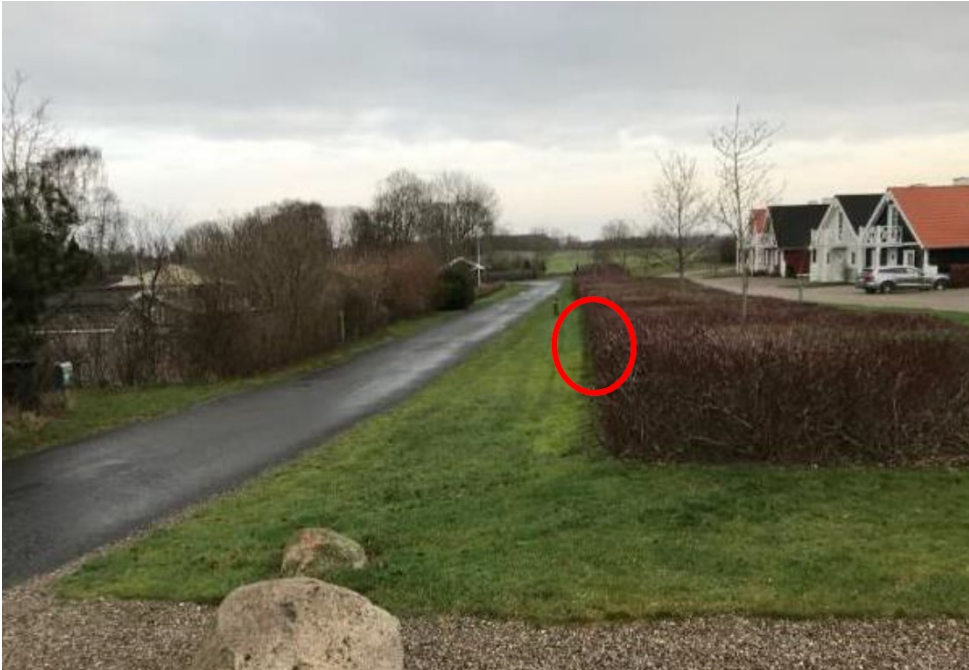
Fig. 4. Foto fra ansøgningsmateriale for den ønskede placering af kubestation.

Området er omfattet af Lokalplan nr. 40 Bro Strand og Lokalplan nr. B77 For et feriecenter ved Bro Strand.