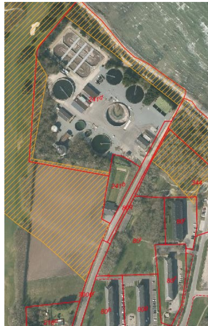
Eksisterende matr. grænser og strandbeskyttelse