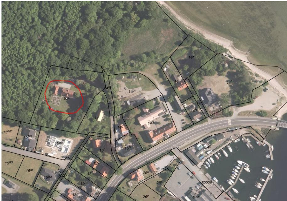
Luftfoto af området. Ejendommen er markeret med en rød cirkel. Mod øst ses en havn. Mod vest og nord er der fredskov.

Der ønskes opført et drivhus, der efter ansøgers oplysninger er afpasset i stil efter husets egen karakter. Ansøger oplyser, at det vil blive opført med muret bindingsværk-brystning og med sten som eksisterende bygning. Drivhuset placeres, så det efter ansøgers vurdering ikke er synligt fra offentlig vej eller fra stranden. Drivhuset placeres inden for 15 meter af boligen.