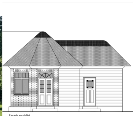
Figur 2: Billedet til venstre viser det nuværende strandhus. Billedet til højre viser den planlagte genopførelse.

Strandhusets toilet ændres således, der er indgang fra husets anneks frem for udvendigt. Det samlede bruttoareal forbliver omtrent det samme. Se figur 3 og 4.