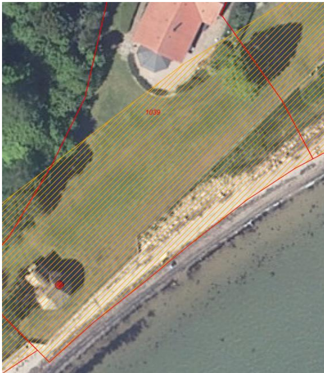
Figur 1: Den orange skravering viser strandbeskyttelseslinjen. Den røde prik viser placeringen af strandhuset.

Bygningen genopføres på samme placering, og med samme anvendelse. Strandhuset opføres med samme taghøjde og med lignende udformning, materialer og størrelse. Se figur 2