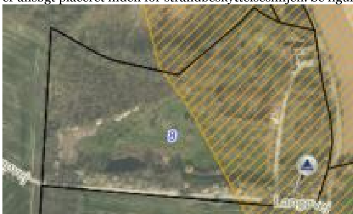
Figur 2: Den orange skravering viser strandbeskyttelseslinjen på matriklen. Mastens placering fremgår af figuren i bunden af højre hjørne på billedet.

Den ansøgte matrikel (nr.8), er delvist dækket af strandbeskyttelseslinjen. Masten er ansøgt placeret inden for strandbeskyttelseslinjen. Se figur 2.