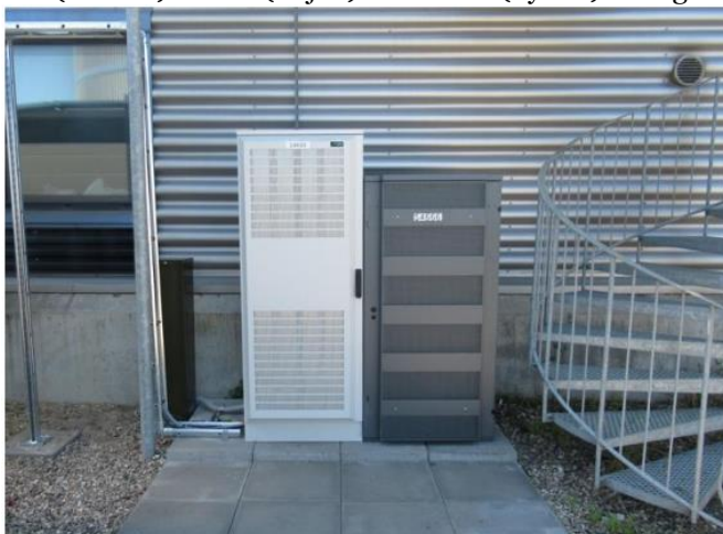
Figur 4: Eksempel på udformning og størrelse på teknikskabe.

I tilknytning hertil ønskes 2-3 teknikskabe etableret. Ét teknikskab måler 800(bredde) x 1000(højde) x 800 mm(dybde). Se figur 4.