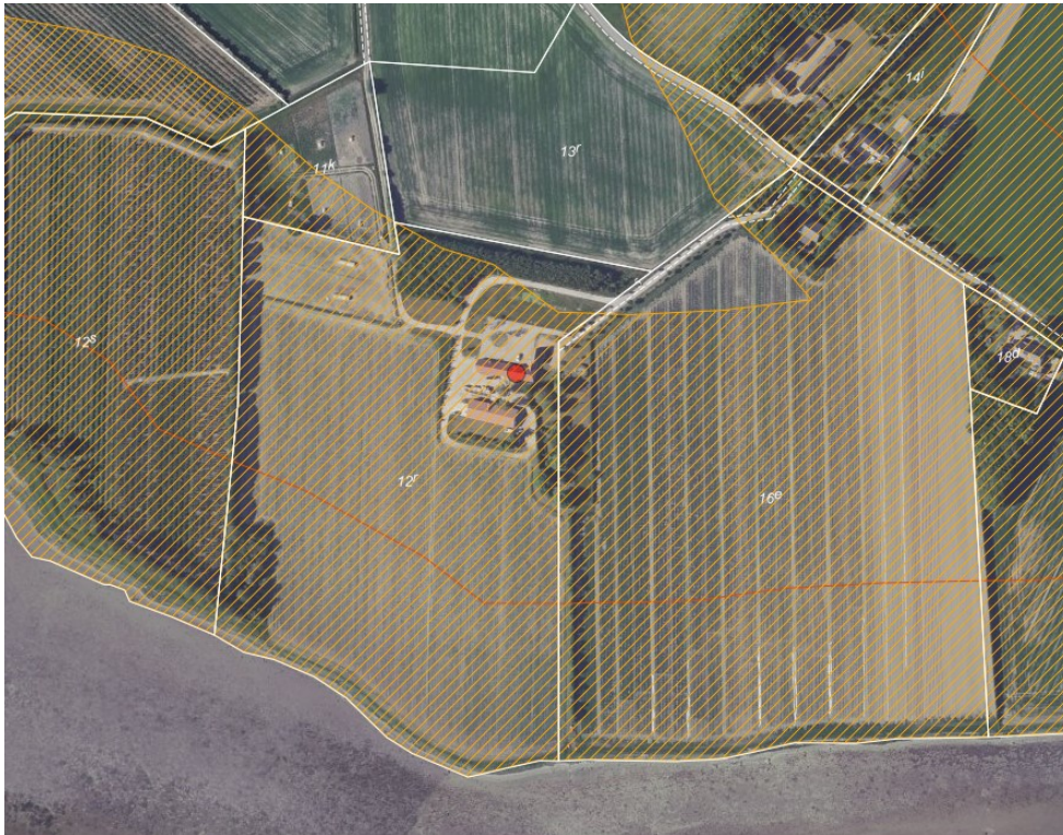
Fig. 1 Viser i hvor stor udstrækning matriklerne er omfattet af strandbeskyttelseslinjen. Den lysorange skravering er strandbeskyttelseslinjen. Den orange streg, der løber parallelt med kystlinjen angiver strandbeskyttelseslinjens 100 m linje.

Efter det oplyste drives landbrugserhvervsejendommen i dag med produktion af grøntsager. Der ønskes en biproduktion af frilandssvin, der kan udnytte restprodukter fra grøntsagsproduktionen. Derfor anses de ansøgte grisehytter som erhvervsmæssigt nødvendige for den pågældende drift.