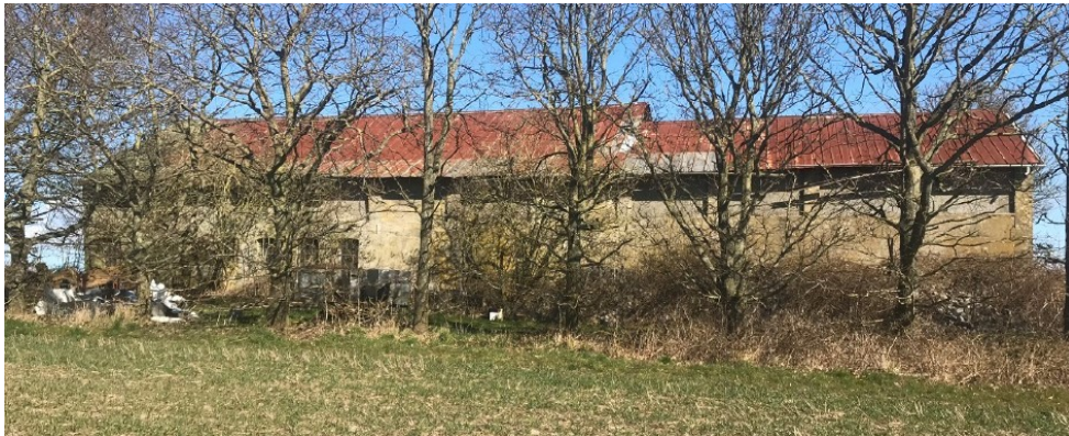
Foto af laden set fra vest.