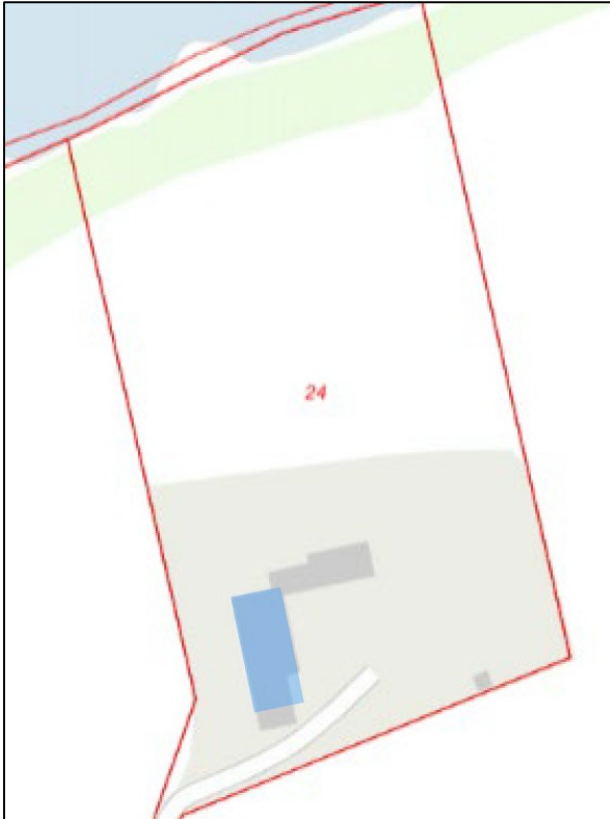
Situationsplan, der viser placeringen af den nye lade (blå firkant) i forhold til den eksisterende