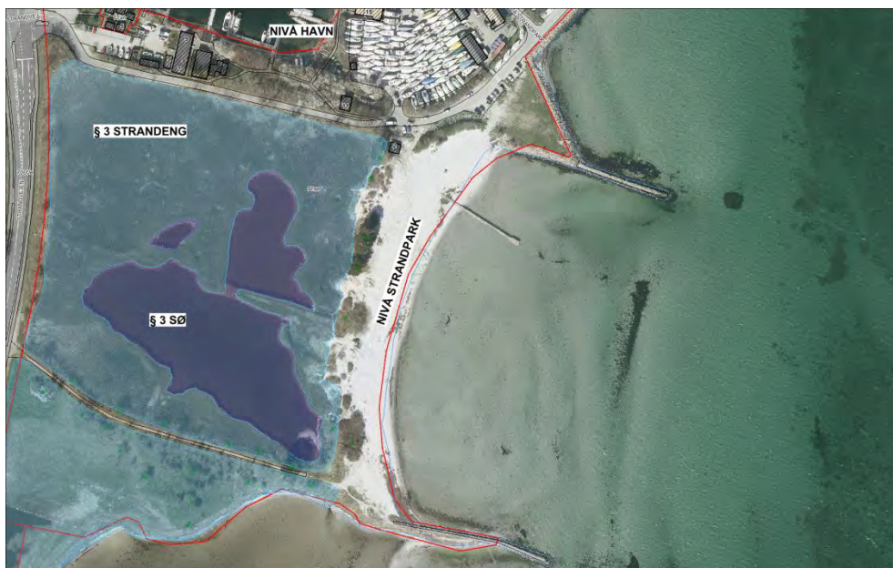
Figur 1: § 3-registrering en gammel lergravssø registreret som § 3 sø omgivet af arealer registreret som § 3 strandeng.

Vest for strandparken er der naturarealer omfattet af bestemmelserne i naturbeskyttelseslovens § 3 om beskyttede naturtyper.