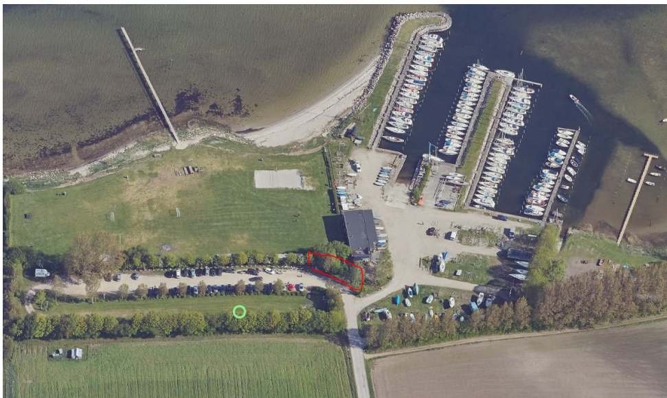
Placering af servicestanderen for cykler inden for rød markering