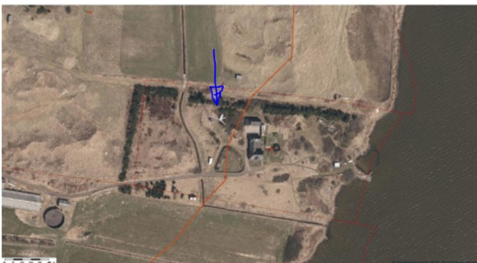
Foto 1. Matrikel 188b, den orangelinje viser den oprindelige 100 m strandbeskyttelseslinje.