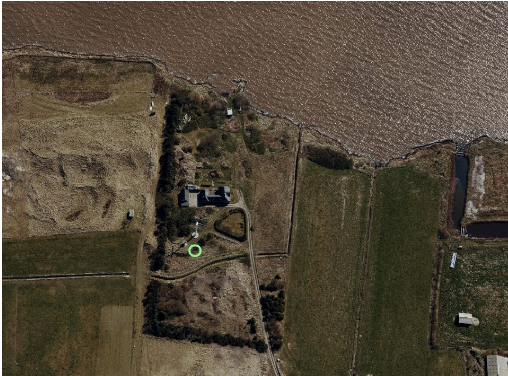
Placeringen af møllen

Diameteren på møllevinderne øges fra 14 m til 15,9 m og tårnhøjden reduceres, således at den samlede højde reduceres fra 25 m til 24,85 m.