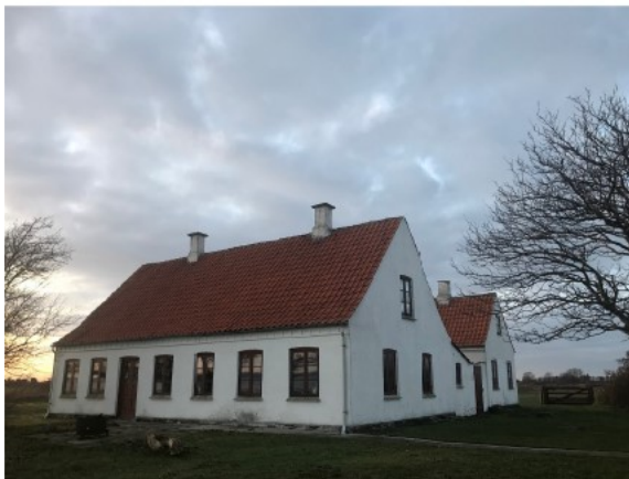
Figur 1, billeder fra ansøgningen af eksisterende bebyggelse

På vegne af ejendommens ejere, Stiftelsen Hofmansgave fremsendte du den 24. september 2019 en ansøgning om dispensation til at ændre anvendelse af udhuset til boligformål, isætte nye terrasse- og yderdøre i udhuset, skifte tagstenene til nye vingetegl med solceller integreret samt etablere en ny, dobbelt terrassedør i sommerhusets nordøstlige gavl.