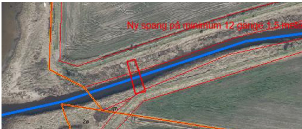
Fig. 1. Placering af spang på matr. 102a, 102b og 115a, Den nordlige Del, Velling.