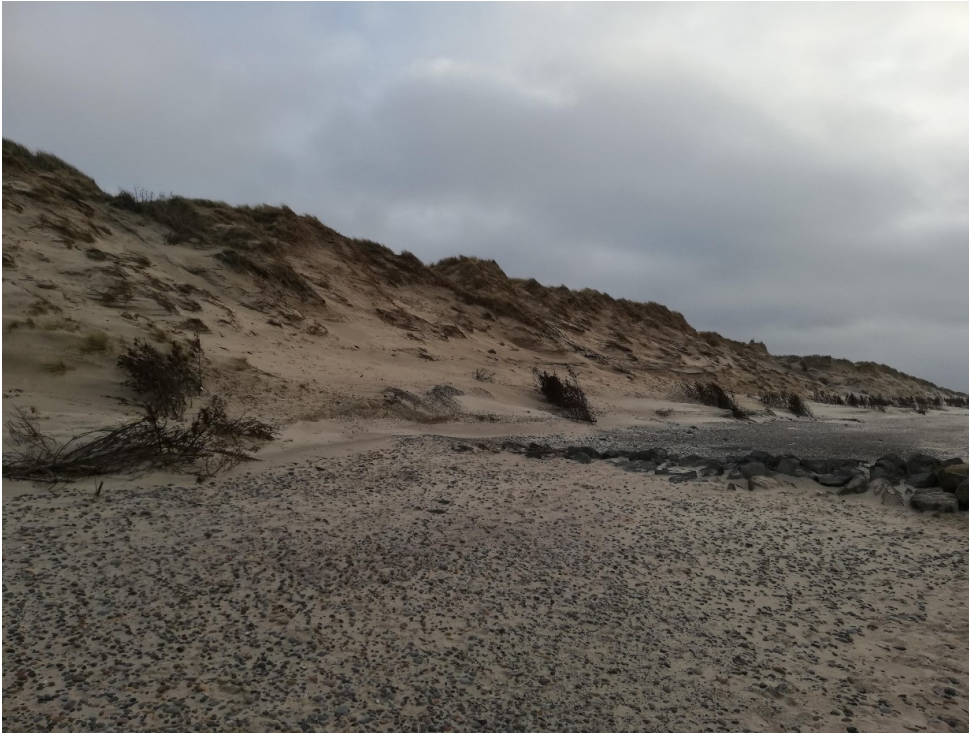
Foto fra ansøgningen, der viser klittens fremtræden mod vandsiden.

Det ønskes derfor at grave de øverste dele af klitten af, således at stejlegheden på vandsiden mindskes. Det afgravede sand lægges på stranden mellem de etablerede kystbeskyttelses anlæg (de skrårstrukturer på ovenstående kort). Der lægges ikke sand ud på den åbne del af stranden.