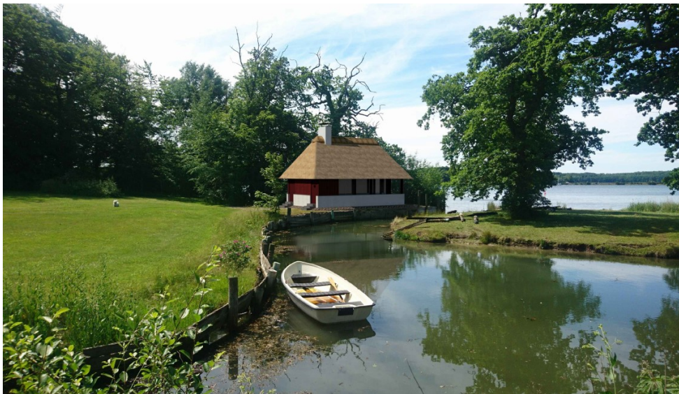
Figur 4, fra ansøgning, perspektiv af ny bygning fra nordøst

Kystdirektoratet har modtaget en ansøgning om, efter nedrivning af det eksisterende lysthus, at opføre et nyt på samme placering. Det nye hus skal opføres med samme formål, som det eksisterende. Det opføres med en muret brystning, ydermure af træ og forsynet med et saddeltag dækket med strå – 48 graders taghældning. Bygningen åbnes op til kip, hvorfor der ikke vil være tagetage. Bygningen forsynes med overdækket areal, som eksisterende, udhæng på omtrent 50 cm og med en bygningshøjde på 6,227 m. Det bebyggede areal er på 61,2 m 2 fordelt på 43,7 m 2 bruttoareal og 17,5 m 2 overdækket areal. Arealet er stort set identisk med det eksisterende. Bygningen vil fremadrettet, som nu, kunne opvarmes, hvorfor der opføres skorsten.