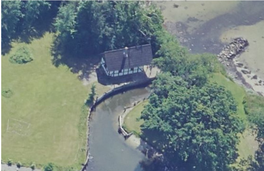
Figur 1, skråfoto 2019 af eksisterende lysthus

Der er indvendig adgang til tagetagen via trappe.