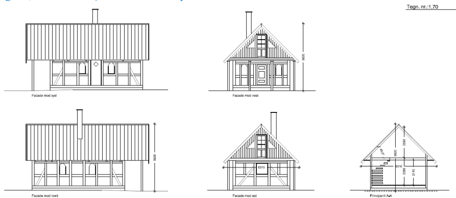
Figur 2, fra ansøgning - tegninger af eksisterende bygning