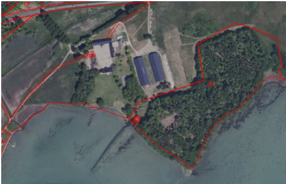
Figur 6, oversigt over Bjørnemosegård på ortofoto fra 2020, lysthuset er placeret ved den røde prik

Nærmeste Natura 2000 område ligger omtrent 3,5 km mod sydøst.