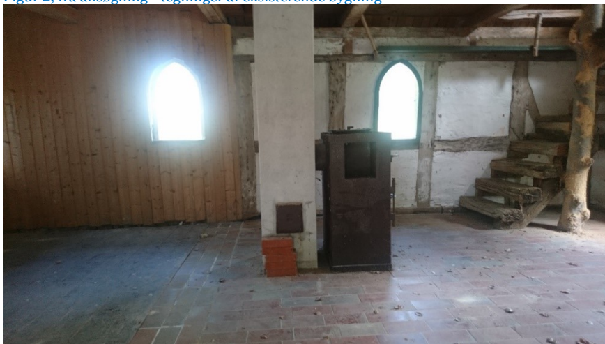
Figur 3, fra ansøgning - billede af eksisterende bygnings interior