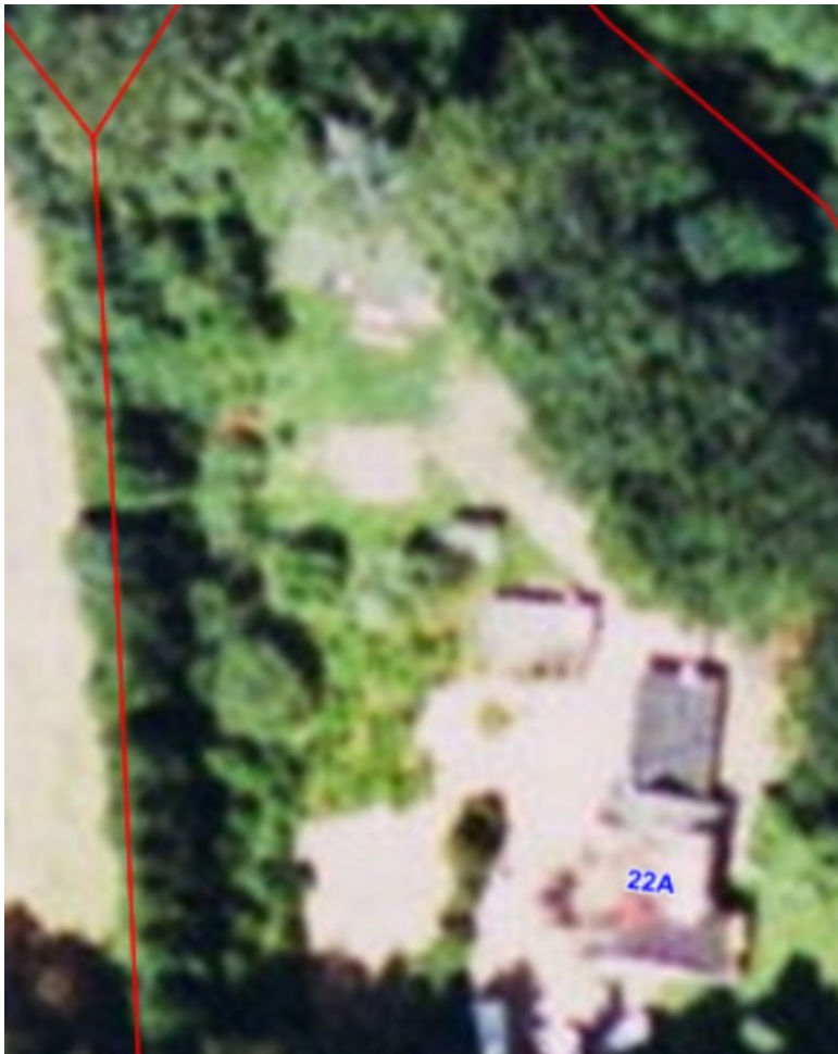
2002 ortofoto, de nuværende bygninger ses på ejendommen ses på dette tidspunkt