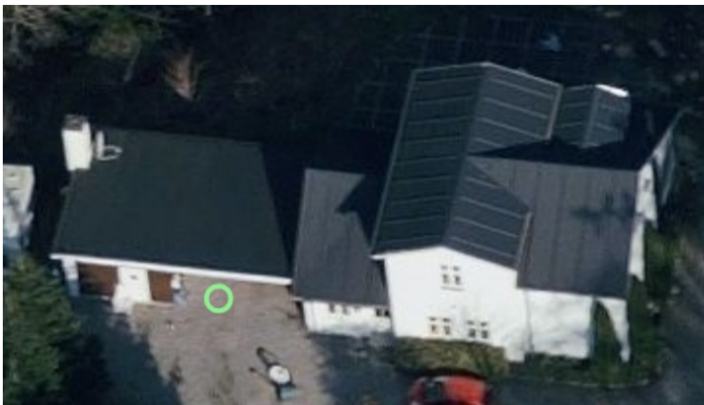
2019 skråfoto. Boligen (nr. 1) ses til højre – carporten ses ved markeringen – skuret på 21 m 2 (nr. 2) ses til venstre i bygningsmassen