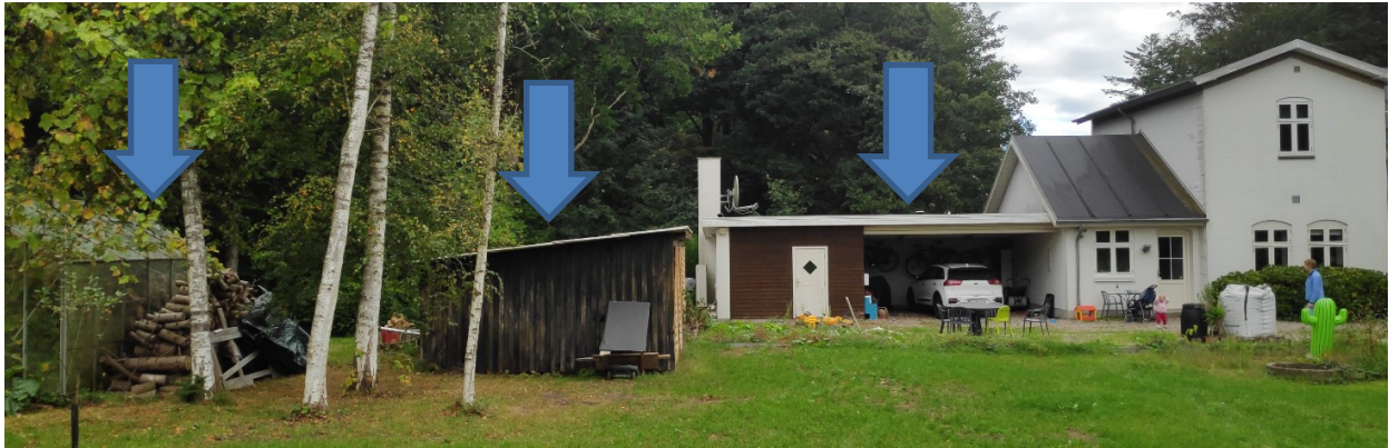
Medsendt foto af drivhus, skur (nr. 7) og skur/carport med beboelse

Udhus opført i træ med tagpapdækning. Skuret er faldefærdigt og erstattes af 3 stk containere (LB 2400 x 6100 mm), som beklædes med lodret træbeklædning alle sider inkl døre, således at helhedsindtrykket bliver en integreret del af natur og skov.