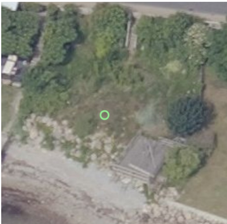
2019, skråfoto af ejendommen set fra vandet

Ejendommen søges bebygget med et skur på 15 m 2 , med 5 m 2 terrasse og udhæng på 25 % af skurets størrelse. Udhængen vil være over terrassen.