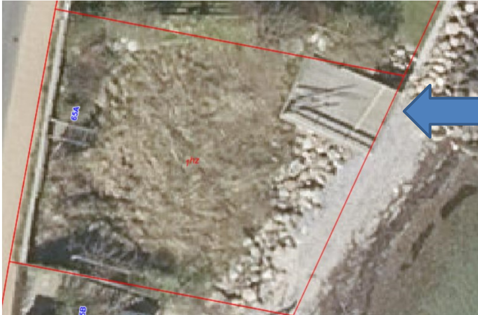
2019, ortofoto, terrassen ses på ved markeringen

Ejendommen er i dag ubebygget, men der ligger en terrasse på ejendommen. Terrassen blev i f.m. den oprindelige dispensation vurderet til at være på 25 m 2 , hvilket lægges til grund i sagen.