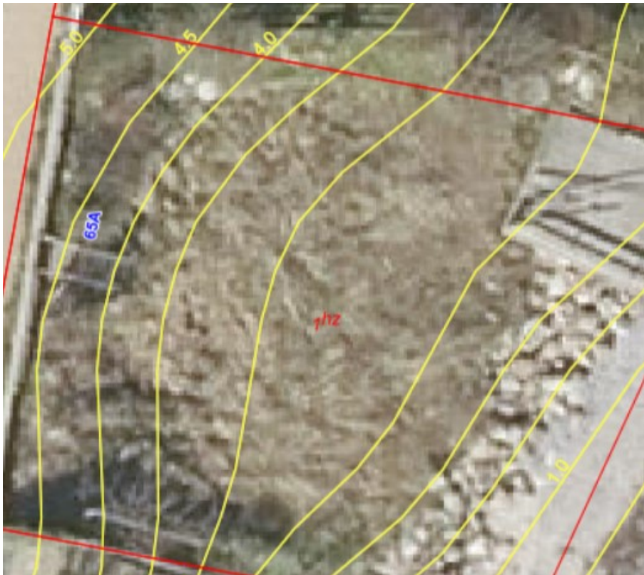
Topografisk kort over ejendommen