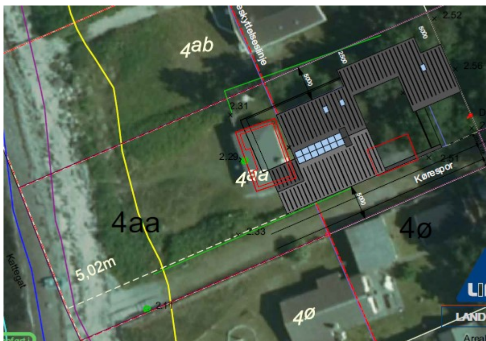
Situationsplan, der viser de ansøgte forhold. Eksisterende bygninger er indtegnet med rødt. Strandbeskyttelseslinjen er indtegnet som en lyserød linje. Den nordlige del af facaden mod vandet flugter med strandbeskyttelseslinjen, og det