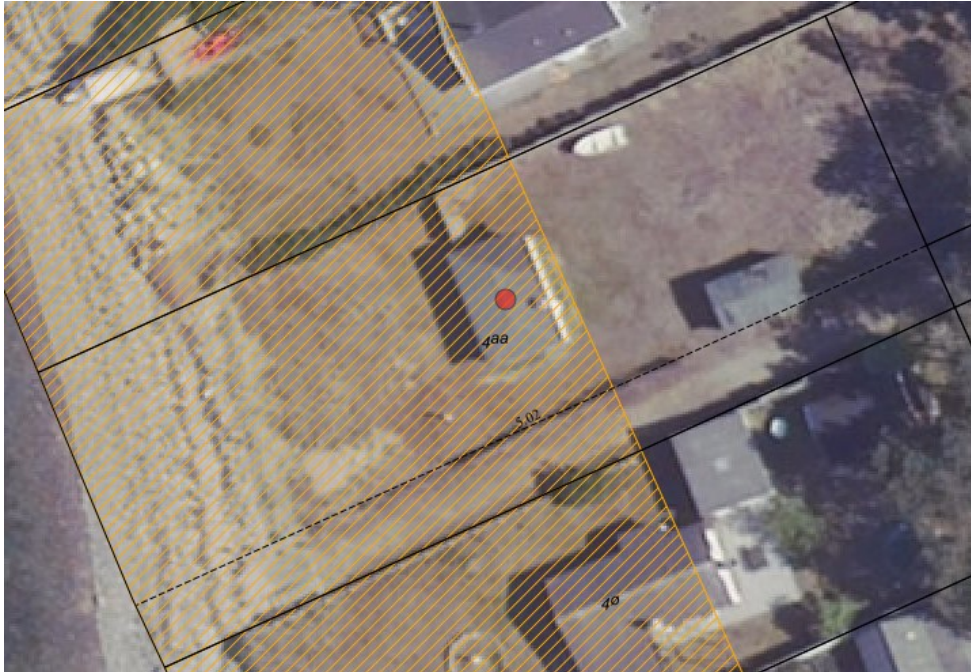
Luftfoto, der viser det eksisterende sommerhus.

ønsker nu at opføre et større sommerhus, hvoraf 29 kvm af det samlede boligareal ligger inden for det strandbeskyttede areal. Der ansøges desuden om at opføre en terrasse i tilknytning til husets vestlige facade mod vandet. Terrassen udføres med en opkant på 40 cm.