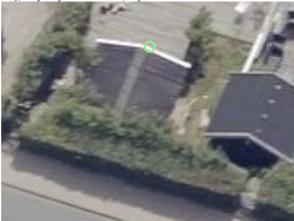
2019, skråfoto af nuværende skur, set fra land