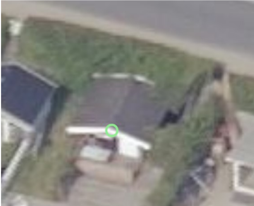
2019, skråfoto af nuværende skur, set fra vandet

Ejer oplyser, at der i dag er et skur på ejendommen på 14,72 m 2 . Det nye skur ønskes placeret samme sted som det nuværende skur.