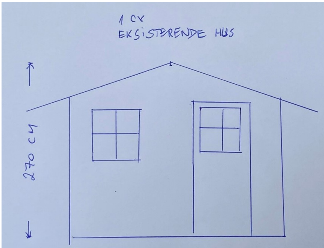
Medsendt skitse med mål på det nuværende skur