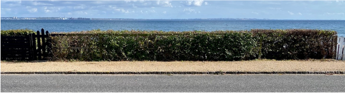
Medsendt foto af ejendommen set fra land. Det ses at skuret ikke rager op over hæk/hegn mod vejen