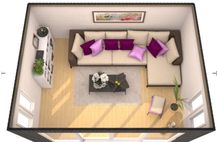
Der er udelukkende vinduer i skurets front og sider