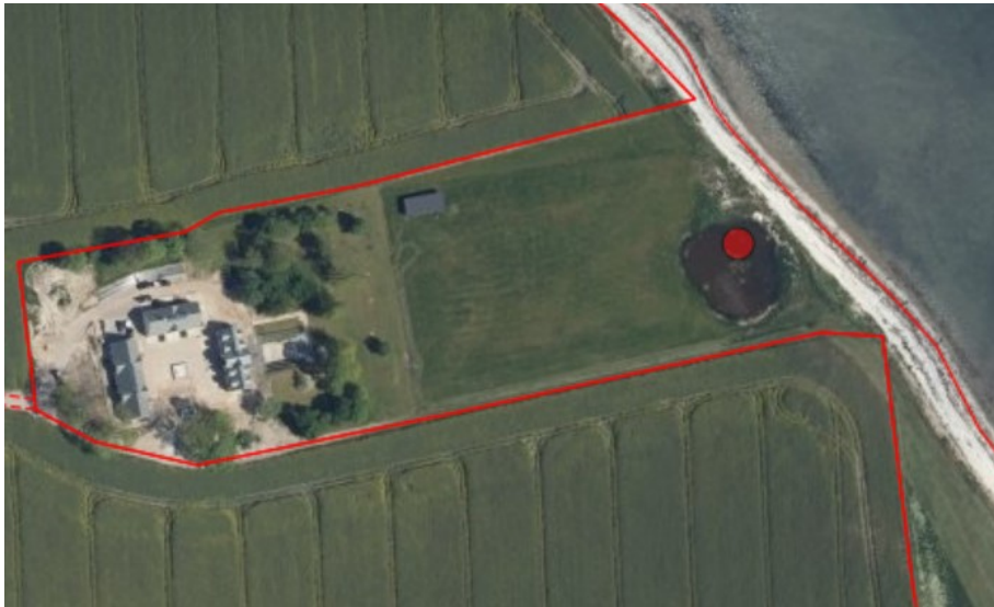
Figur 1, ortofoto 2020, vandhul vist med rød prik

Ved gennemgang af ortofotos, er det Kystdirektoratets vurdering, at der har været et vandhul med meget svingende vandstand i gennem rigtig mange år. Af de høje målebordsblade fra 1842-1899 ses vandhul på stedet.